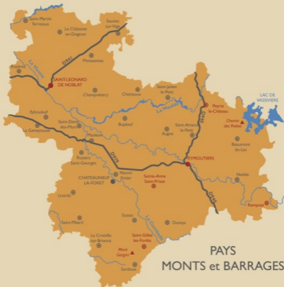
PAYS MONTS et BARRAGES